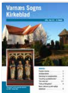
Kirkeblad April/Juni 2021

Der blev arbejdet i et års tid med at indsamle billeder i en ”billedbank” med henblik på at ændre forsiden. I 2021 kom der en ny version på gaden. Det var i marts/april udgaven i 2021, vi ændrede