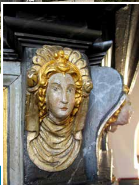
Prædikestol (fra 1606) med buste af en adelsdame klædt i tidens modedragt.